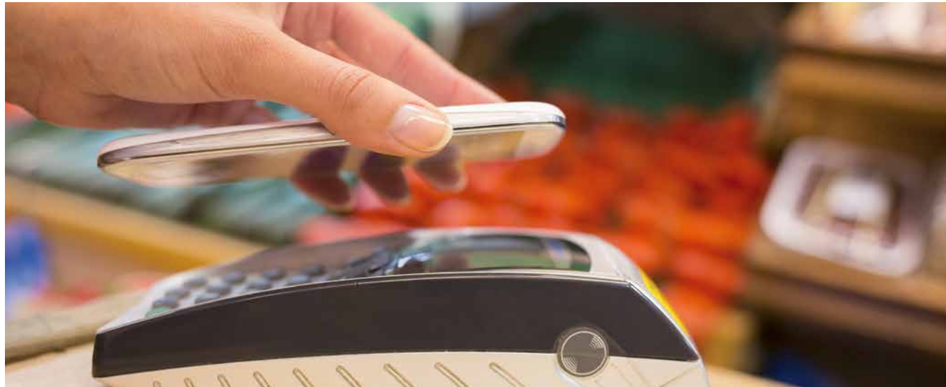
Der kontaktlose Zahlungsverkehr macht das bargeldlose Zahlen besonders einfach und bequem für den Nutzer.